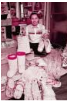
体験教室でわら細工を教える