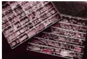
同社が作った各種部品

車、音響機器、携帯電話、医療機器、現金引き出し機などのATM機など、現在世に出回っている商品は、すべて細かくて精密な部品ででき上がっていますが、その精度は、1ミクロン(1ミリの千分の1)のさらに何千分の1、何万分の1というもの。同社の熊谷